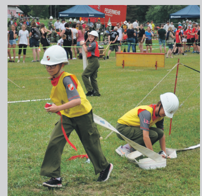
Bewerb in Liebenstein