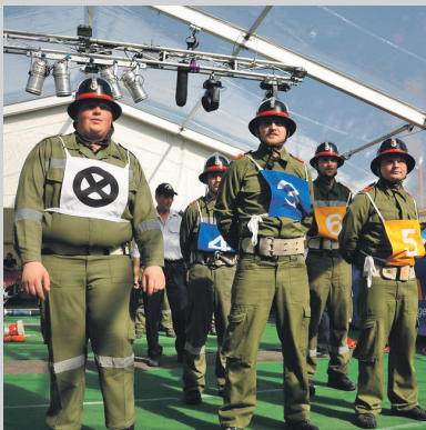
Kuppelbewerb in Albrechts