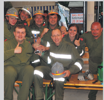
Bewerb in Hagenberg