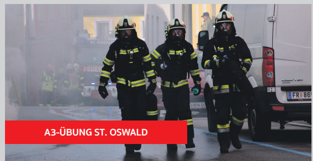
A3-ÜBUNG ST. OSWALD

Rettung einer bewusstlosen Person aus einem ca. 6 Meter hohen Hallenkran. Mit vereinten Kräften konnte diese Übung erfolgreich durchgeführt werden.