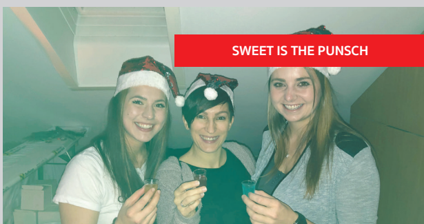
SWEET IS THE PUNSCH

Unser Kommandant und sein Stellvertreter haben den Zugkommandanten- und Kommandantenlehrgang erfolgreich abgeschlossen.