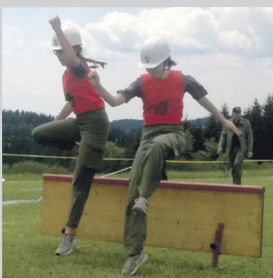
Bewerb in Spörbichl