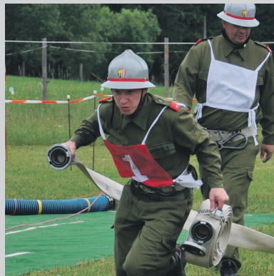
Bewerb in Liebenstein