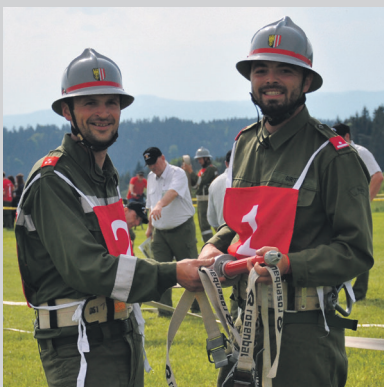
Bewerb in Spörbichl