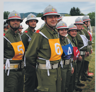
Landesbewerb in Frankenburg