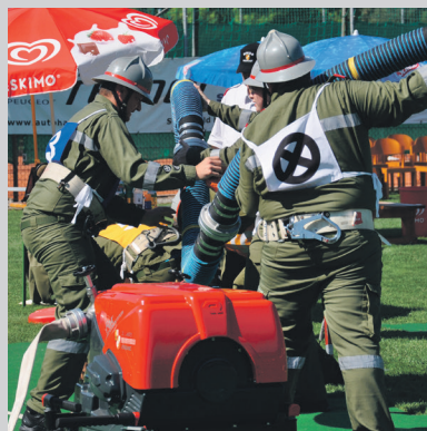
Bezirksbewerb in Kefermarkt