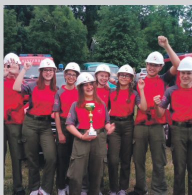
Bewerb in Liebenstein